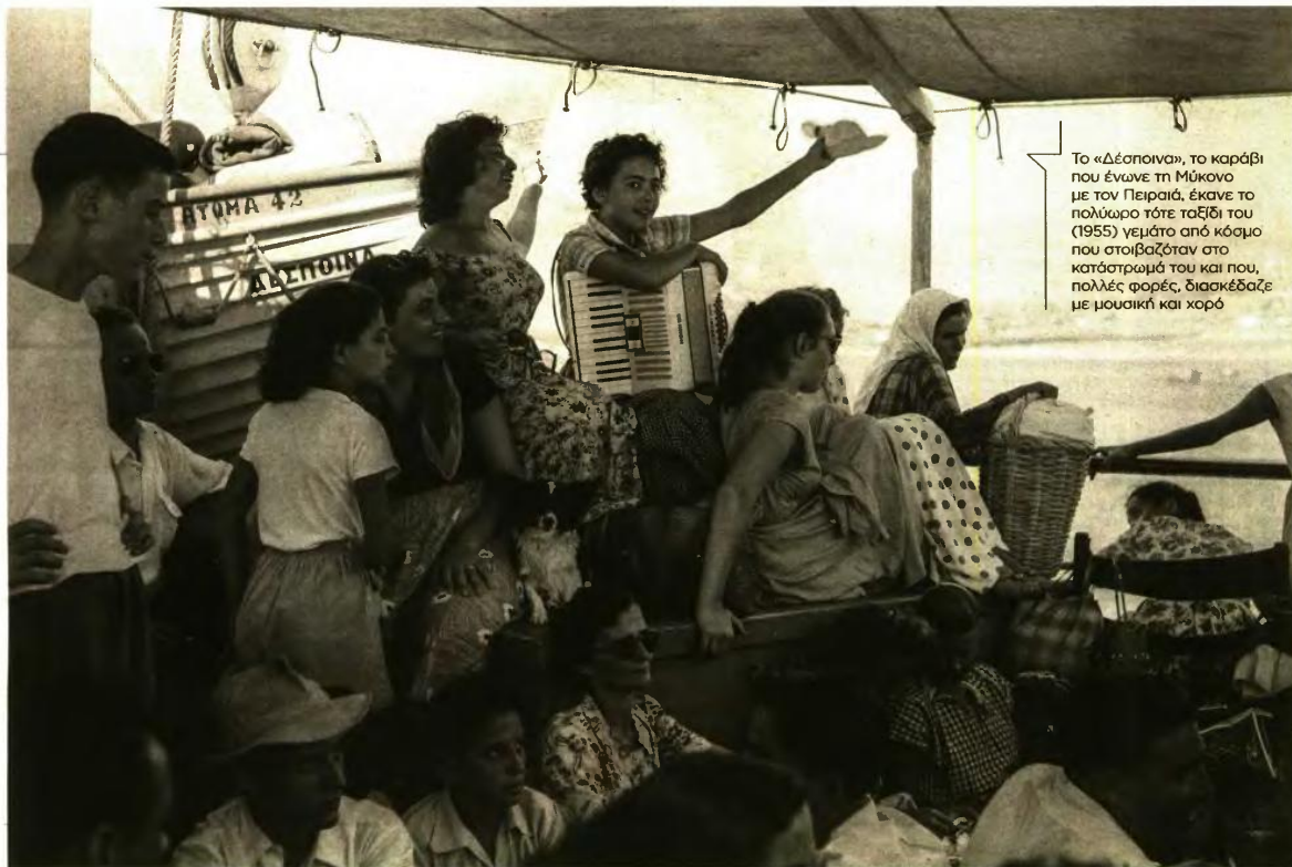
Το «Δέσποινα», το καράβι που ένωσε τη Μύκονο με τον Πειραιά, έκανε το πλώρω τότε ταξίδι του (1955) γεμάτο από κόσμο που στοιβαζόταν στο κατάστρωμά του και που, πολλές φορές, διασκεδάζε με μουσική και χορό