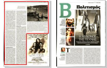
Το 1955 ο Παλιός, η παραλία που βρίσκεται στο παλιό λιμάνι, ήταν γεμάτος από ψαροκάικα. Σήμερα βουλιόζει από τουρίστες που πάνε για να απολαύσουν το μπάνιο τους