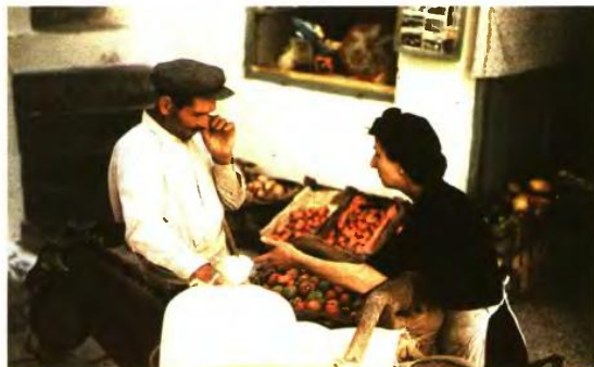
Η Χώρα εξακολουθεί να είναι το εμπορικό κέντρο του νησιού, όμως σήμερα είναι γεμάτη από ακριβές μουσικά και εστιατόρια. Το 1957 η μεταφορά εμπορευμάτων με γαϊδουράκια ήταν μια συνηθισμένη εικόνα

Μια ματιά στις εκδηλώσεις που θα πραγματοποιηθούν στο φωτεινό νησί των Κυκλάδων, από το «Mykonos Art Festival» μέχρι την έκθεση-εορτασμό για τα 200 χρόνια της Επανάστασης με τον τίτλο «Το αρχιπέλαγος φλέγεται», αλλά και το εγχείρημα του Νίκου Διαμαντή «ΕΞΑΓΩΓΗ-ΕΞΟΔΟΣ, ένα θεατρικό ορατόριο για την ελπίδα και την καρτερία» που θα παρουσιαστεί στη Δήλο